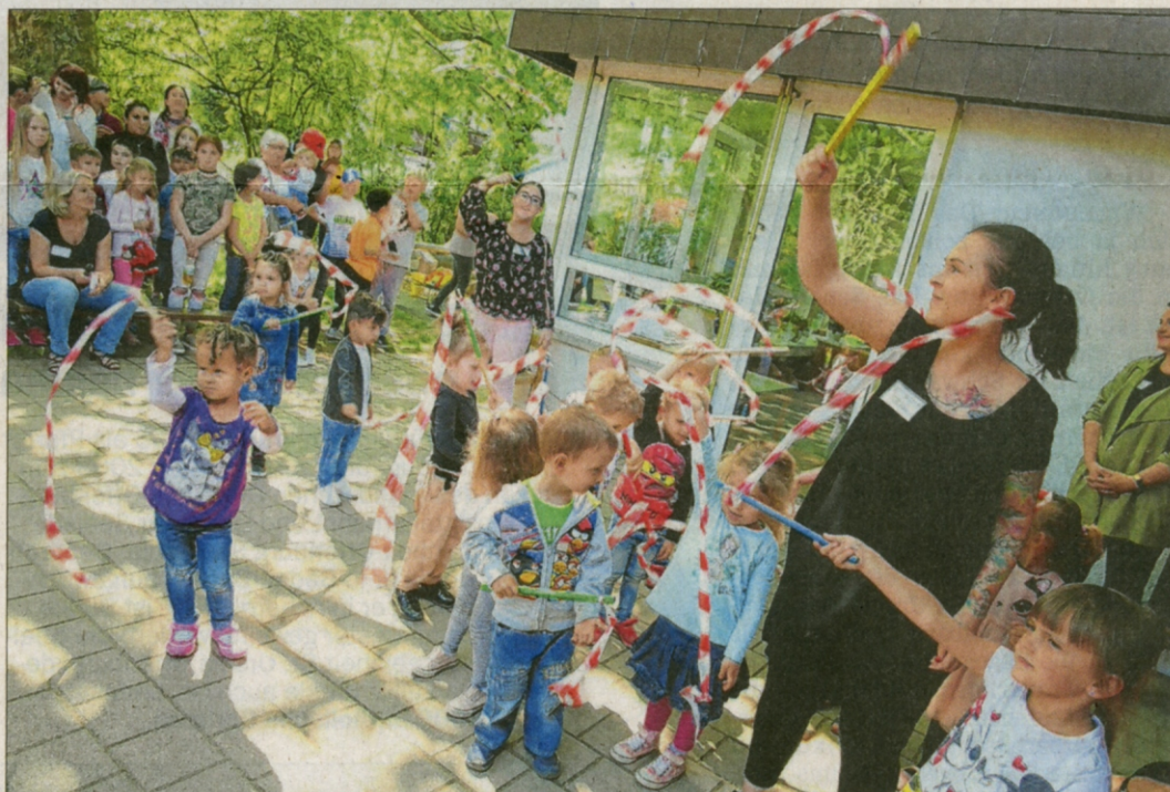
Mit einem pffiffigen Unterhaltungsprogramm umrahmten Kinder und Erzieherinnen die Einweihungsfeier des neu gestalteten Außengeländes.

Mit einem Unterhaltungsprogramm, welches das Thema »Bauarbeiten« aufgriff, bedankten sich die Kinder und das Team: Ob eine Combo à la »Stomp« in Signaljacken und Helmen von »An die Arbeit, Leute!« bis »Feierabend!« trom-